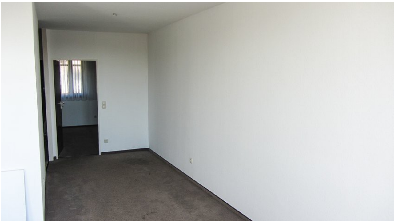
Wohnzimmer Ansicht 1