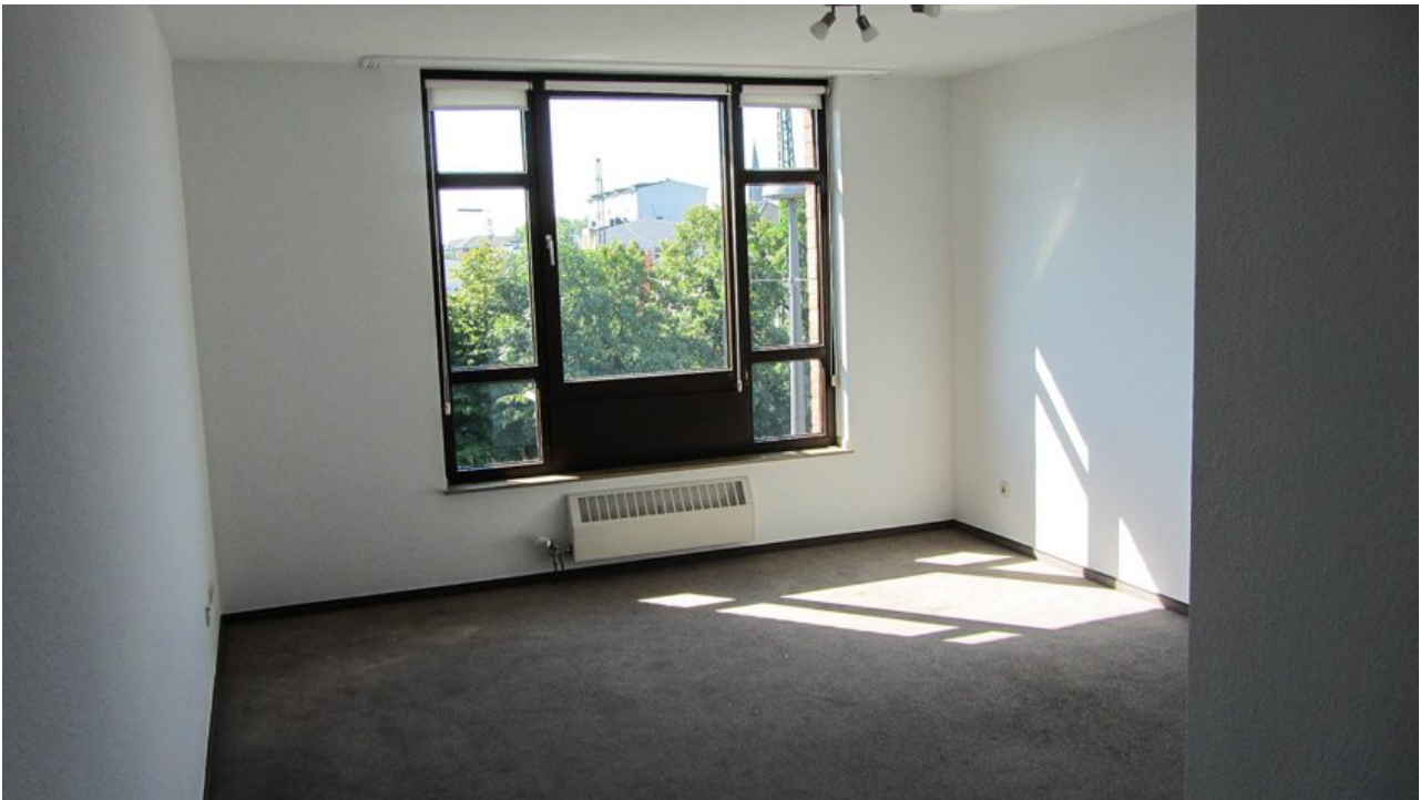
Wohnzimmer Ansicht 2